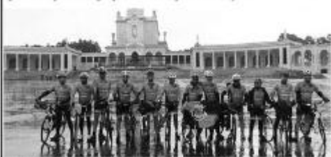
Associação e BTT proporcionou um passeio diferente

zade imperaram esta aventura. "A RODACTIVA/SEM ESPINHAS, neste ciclo peregrinação, contou com a incansável e permanente ajuda do seu staff composto por 7 elementos da associação, com o apoio dos Bombeiros Voluntários de Beja, da Santa Casa da Misericórdia de Coruche, assim como a preciosa colaboração da Junta de Freguesia e da Câmara Municipal de Castro Marim, que ajudaram a concretizar este Evento", pode ler-se num comunicado enviado às redações pela associação.