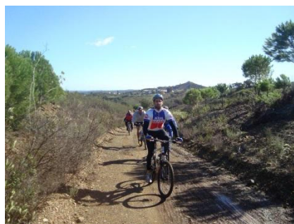
Algumas fotos do Evento

telm.: 96 52 84 857 arcdaa@gmail.com www.arcdaa.com